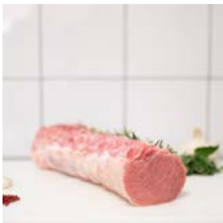
ARISTA di MAIALE DISSOATA Consigliata al forno o al latte in padella