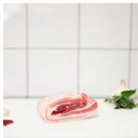
PANCETTA FRESCA Da fare arrostita o alla brace