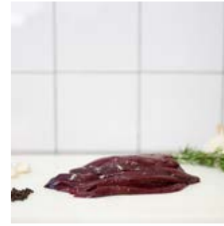
FEGATO Consigliato in padella, ottimo alla veneziana