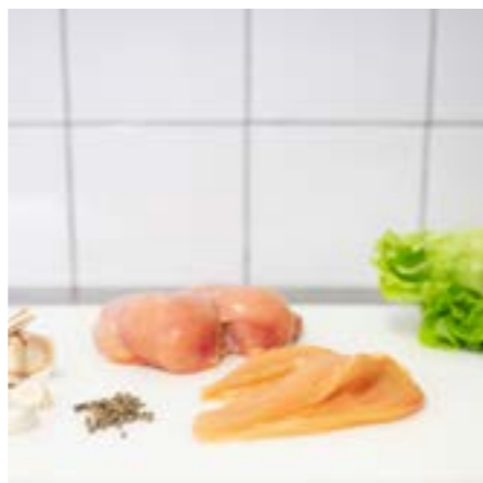
PETTO di POLLO RUSPANTE Consigliato alla griglia o in padella