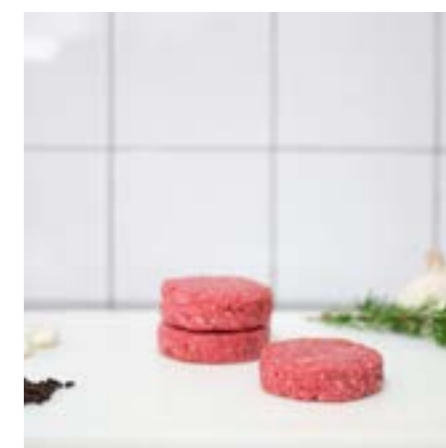
BURGER di MANZO Per svizzera o hamburger, da non cuocere troppo