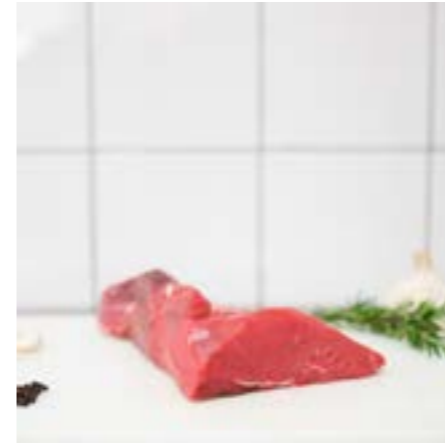
CIMALINO Consigliato per Roast beef