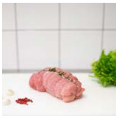
ARROSTO di TACCHINO Consigliato al forno