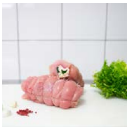
FESA di TACCHINO RIPIENA Consigliato al forno