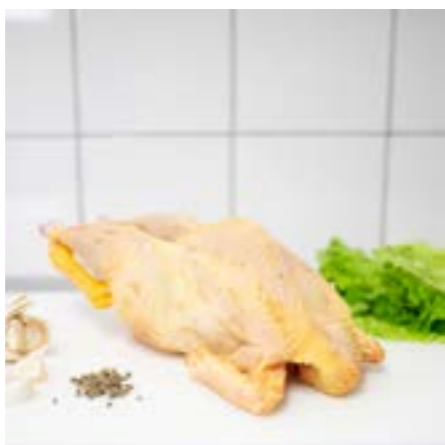
POLLO RUSPANTE INTERO Perfetto arrosto in forno