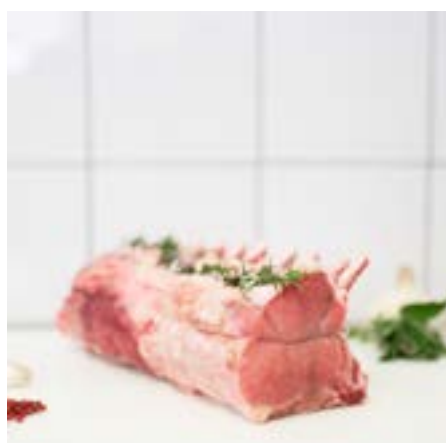
ARROSTO di MAIALE con OSSO Consigliato al forno