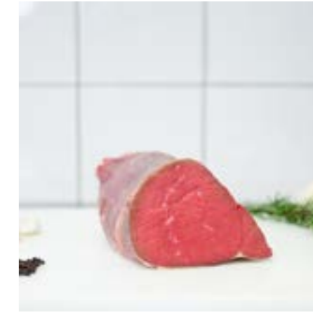
GIRELLO - 18€ KG Consigliato per Roast beef