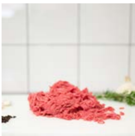
MACINATO di MANZO Per ragù, polpette, polpettone...