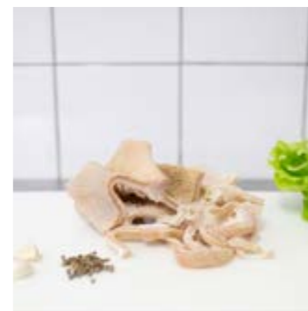
TRIPPA Consigliata in umido