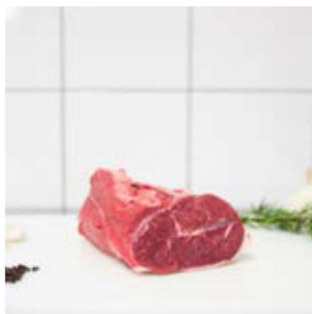
MUSCOLO Consigliato per bollito o spezzatino