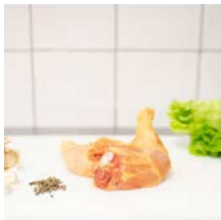
COSCIO e ANCA di POLLO RUSPANTE Consigliato alla griglia o al forno