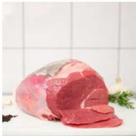
ROSETTA Consigliato all'olio o arrosto