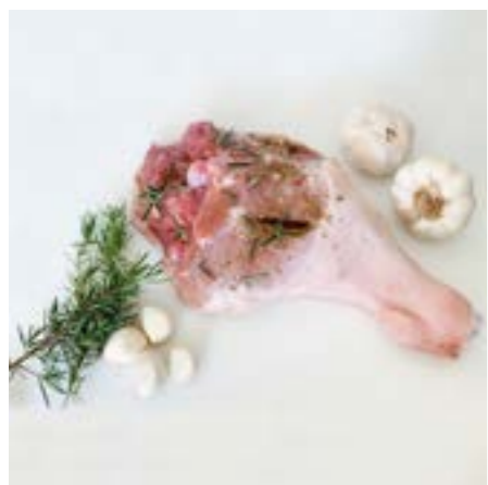
PROSCIUTTO DI MAIALINO Consigliato al forno