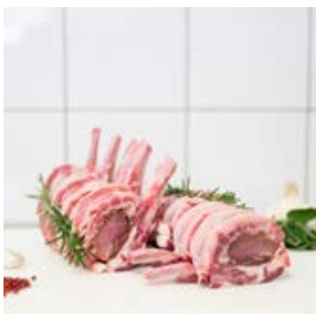
ROSTICCIANA RIPIENA Consigliata da fare arrosto