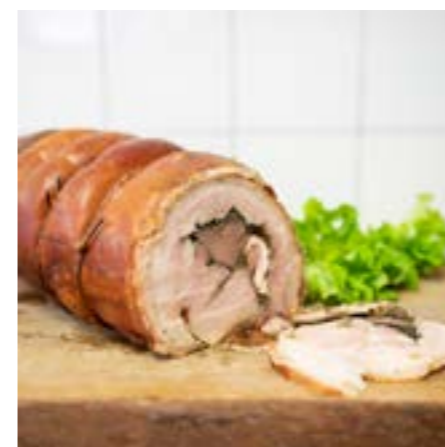
PORCHETTA Ingredienti: busto di suino, sale, pepe, spezie, aglio, rosmarino, semi di finocchio