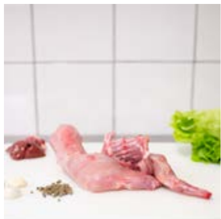
CONIGLIO NOSTRALE Consigliato arrosto o in umido