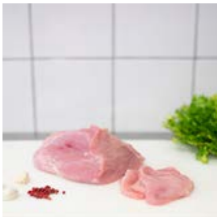
PETTO di TACCHINO Consigliato alla griglia o in padella