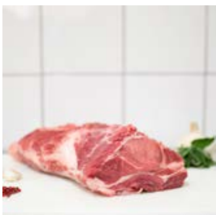
SCAMERITA Consigliata alla brace