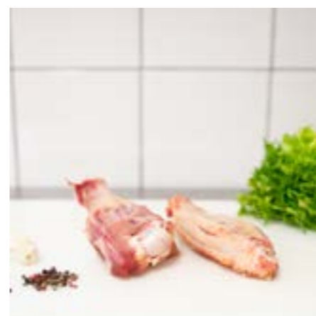
ALA di TACCHINO Consigliata arrosto in forno