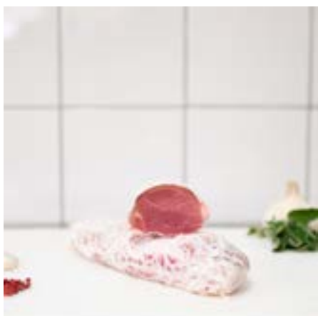
FILETTO di MAIALE in RETE Consigliato da fare arrosto