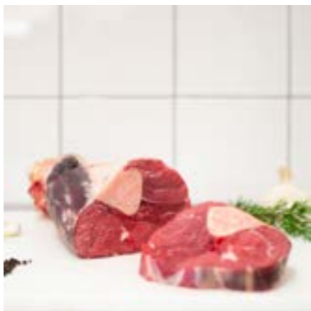
OSSOBUCCO Ottimo in umido