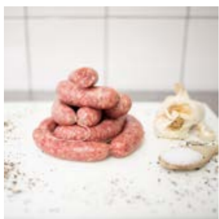
SALSICCIA TOSCANA CLASSICA In padella o alla brace