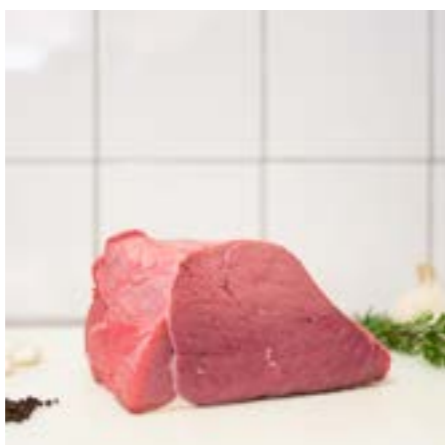
SOTTOBOCCO Fettine da friggere o alla pizzaiola