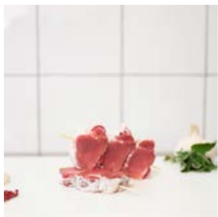
SPIEDINI di FILETTO di MAIALE Da fare anche in padella