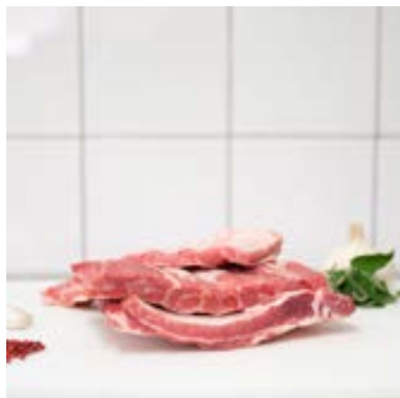
ROSTICCIANA Consigliata arrosto o sulla brace