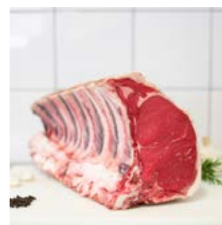
BISTECCA nella COSTOLA Consigliata da fare alla brace