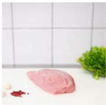
FESA di TACCHINO Ottima alla griglia