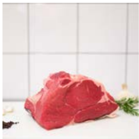
GROPPA Consigliato all'olio o arrosto