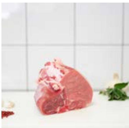
ARISTA di MAIALE nel FILETTO Consigliata al forno