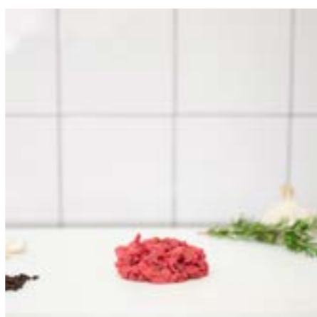
TARTARE BATTUTA al COLTELLO Consigliata da condire solo con olio, limone, sale e pepe