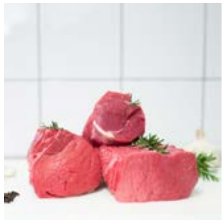
NOCE, BICCHIERE e GROPPA Consigliato per il Roast beef