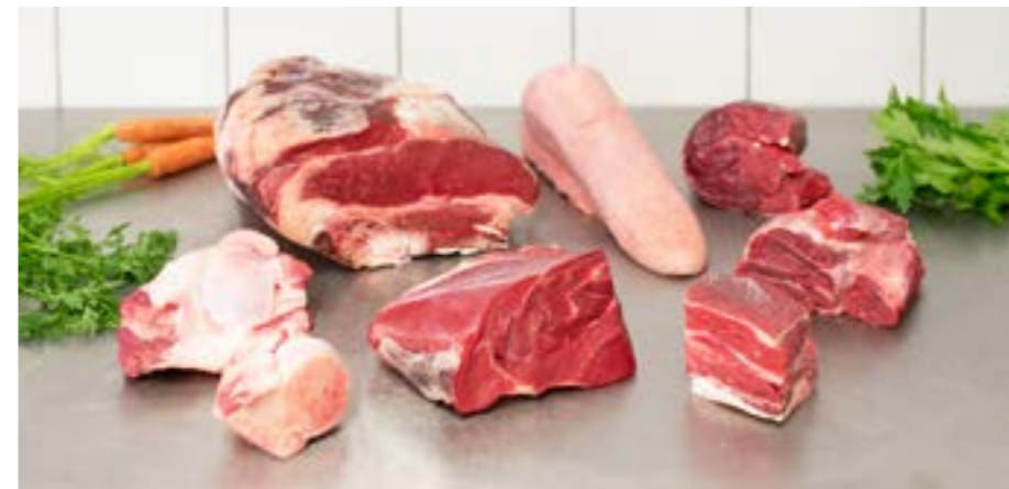
BOLLITO MISTO (MUSCOLO - LINGUA - COSTOLATO - SPICCHIO di PETTO)