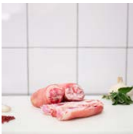
PIEDINI di MAIALE Consigliati bolliti, in umido o per il brodo