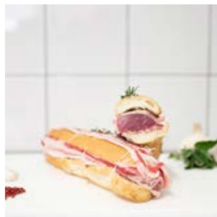
FILETTO di MAIALE in CROSTA Consigliato da arrostito in forno