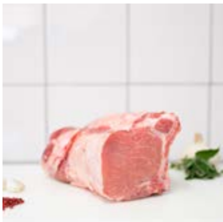
ARISTA di MAIALE con OSSO Consigliata al forno