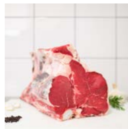
BISTECCA nel FILETTO Consigliata da fare alla brace