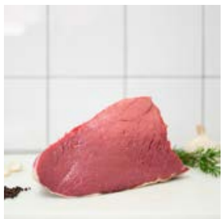
SCANNELLO Consigliato all'olio o arrosto