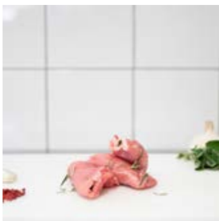
INVOLTINI di MAIALE con PROSCIUTTO COTTO, FORMAGGIO e SPINACI Consigliati in padella